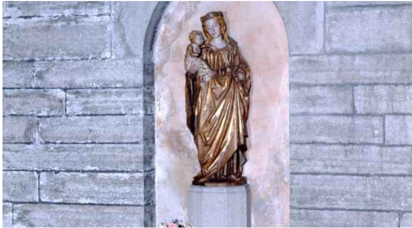
Sankt Birgitta af Vadsrena