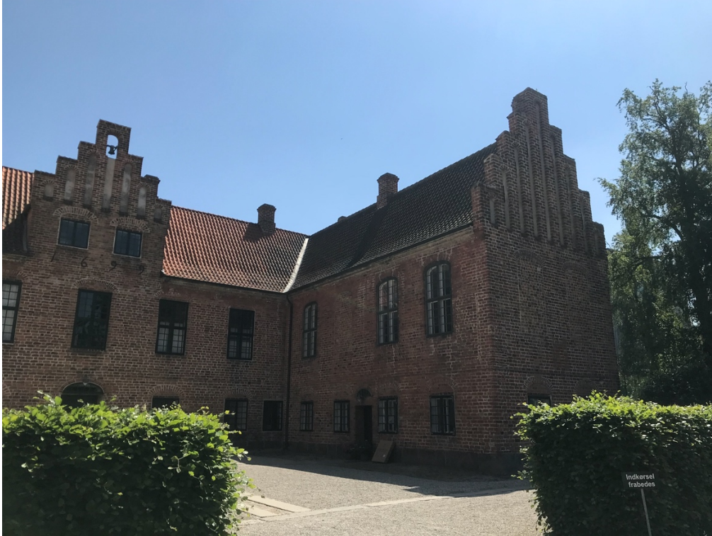
Roskilde Kloster: den nyrenoverede Klosterkirke ligger til højre på 1. sal