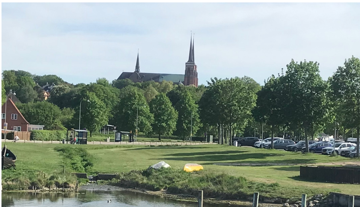
Skabelsesgudstjeneste i Roskilde Domkirke den 24. september kl. 17